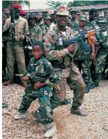
Skrupelløse krigsherrer tvinger børn til at gå i krig.

- Vi har altid en overlevelsestaske på os. Jeg var bange i starten, men det skal man ikke vise. Det reagerer soldaterne på. Det gælder om at være en hård banan og råbe højt. Men oveni 14-15 timers dagligt arbejde bliver usikkerhe-